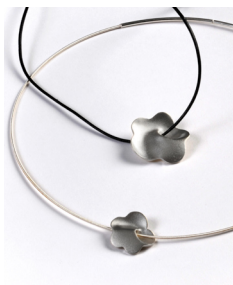
Oz Jewel, Tiina Arkko Jäkälänkukka -kaulakorut